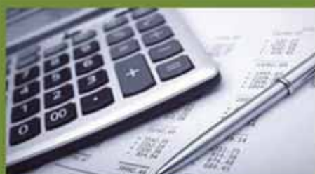
Rapport sur la situation financière 2014