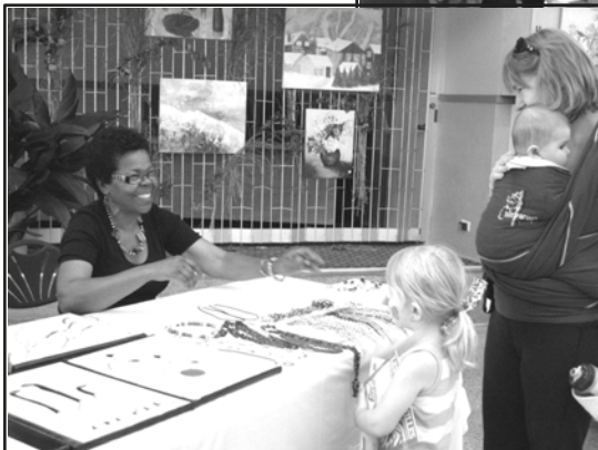
Une artiste qui accueille des visiteurs conquis!

Il y avait aussi un comptoir où l'on pouvait acheter quelques produits du terroir, tandis qu'un jeune musicien agrémentait la fête parfois au violon, parfois au piano. Une