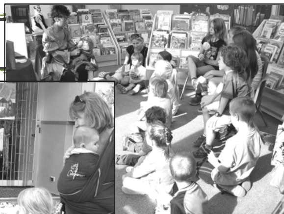
Un public attentif!