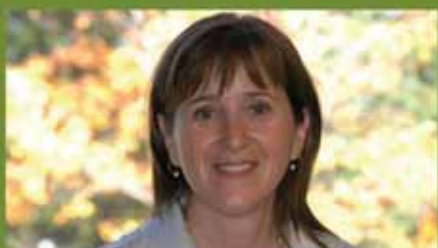
Premier discours de la nouvelle mairesse

À ne pas manquer : ouverture des patinoires et festivités du Carnaval des Neiges